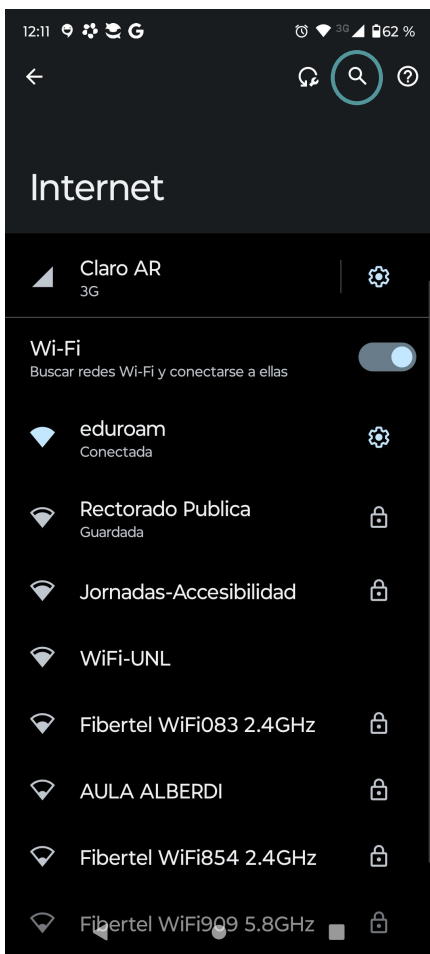
Fig 1.1: Abrir las redes disponibles y en la lupa escribir “certificado”.