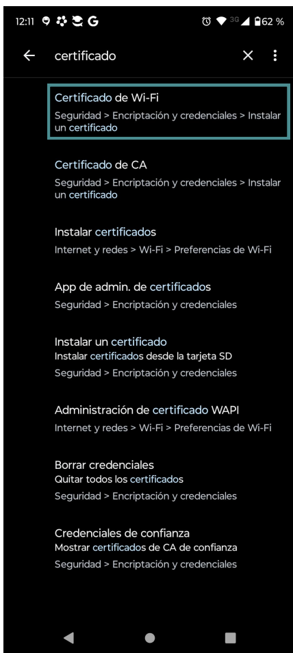
Fig. 1.2: Seleccionar “Certificado de Wi-Fi”