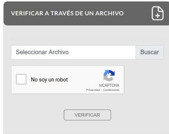
Fig. 2.1.: Verificador de Documentos, opción de verificar documento en formato digital.

Esta opción, tal como lo indica su encabezado, permite a los usuarios de este portal público subir un archivo en formato .pdf, siempre que lo tengan en su poder, utilizando el botón “Examinar”. De este modo, pueden proceder a la verificación de sus metadatos, lo que incluye tanto las propiedades del documento como las de los certificados digitales de los firmantes.