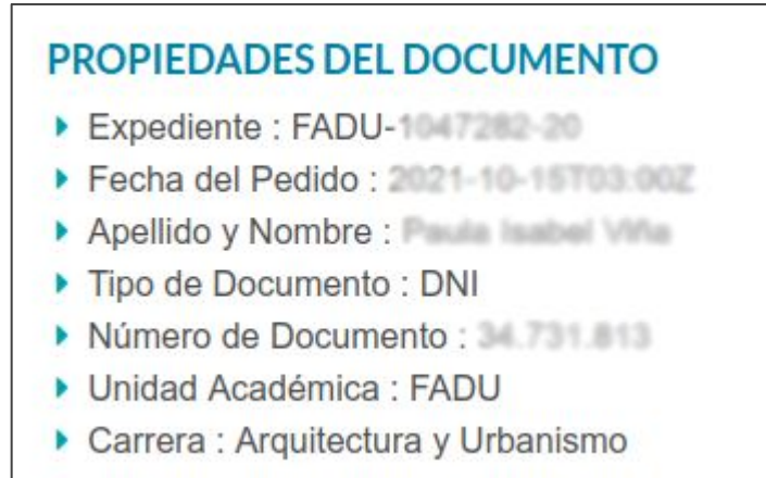
Fig. 2.4.: Verificador de Documentos, opción de verificar documento en formato impreso a través del código único o del código QR.