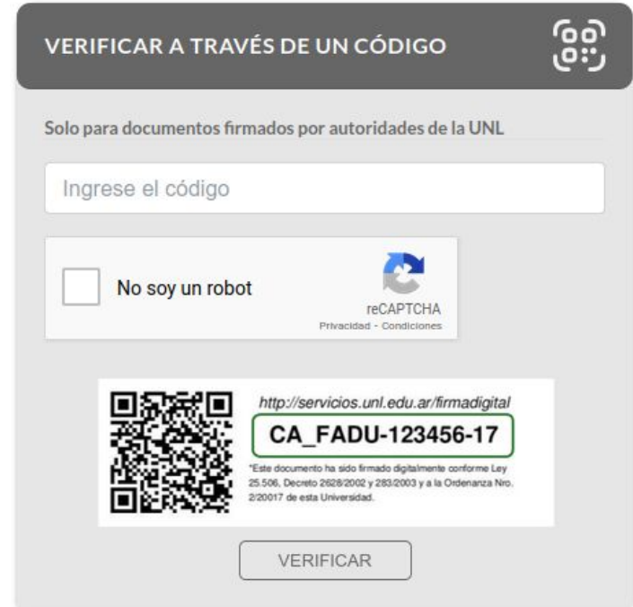
Fig. 2.2.: Verificador de Documentos, opción de verificar documento en formato impreso.

A partir de la implementación de estos proyectos de gestión administrativa digitales, los trámites realizados en este marco cuentan con un identificador único que surge de la concatenación de las iniciales del tipo de trámite y del identificador de expediente del Sistema Único de Gestión de Expedientes que posibilita, para el interesado y para las terceras partes en general, realizar el seguimiento o la trazabilidad del trámite. Para el caso de los trámites correspondientes a la solicitud y emisión de Certificados Analíticos de Estudios finales, el código único se compondrá por las iniciales “CA_” y el identificador único de expediente. Caso de ejemplo: “CA_FADU-123456-17” Asimismo, cabe destacar que se puede acceder a la información de Verificación del documento, mediante la captura del código QR embebido en el mismo documento.