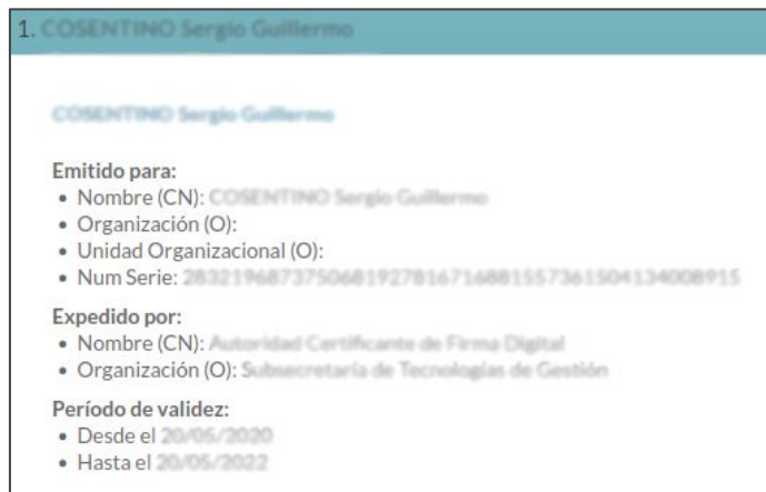
Fig.2.5.: Verificador de Documentos, propiedades del (los) certificados digitales firmantes.

Es importante destacar que estos certificados son emitidos por la Autoridad Certificante de la ONTI (AC-ONTI), con la AR-UNL actuando como intermediaria entre los solicitantes y la Autoridad Certificante.