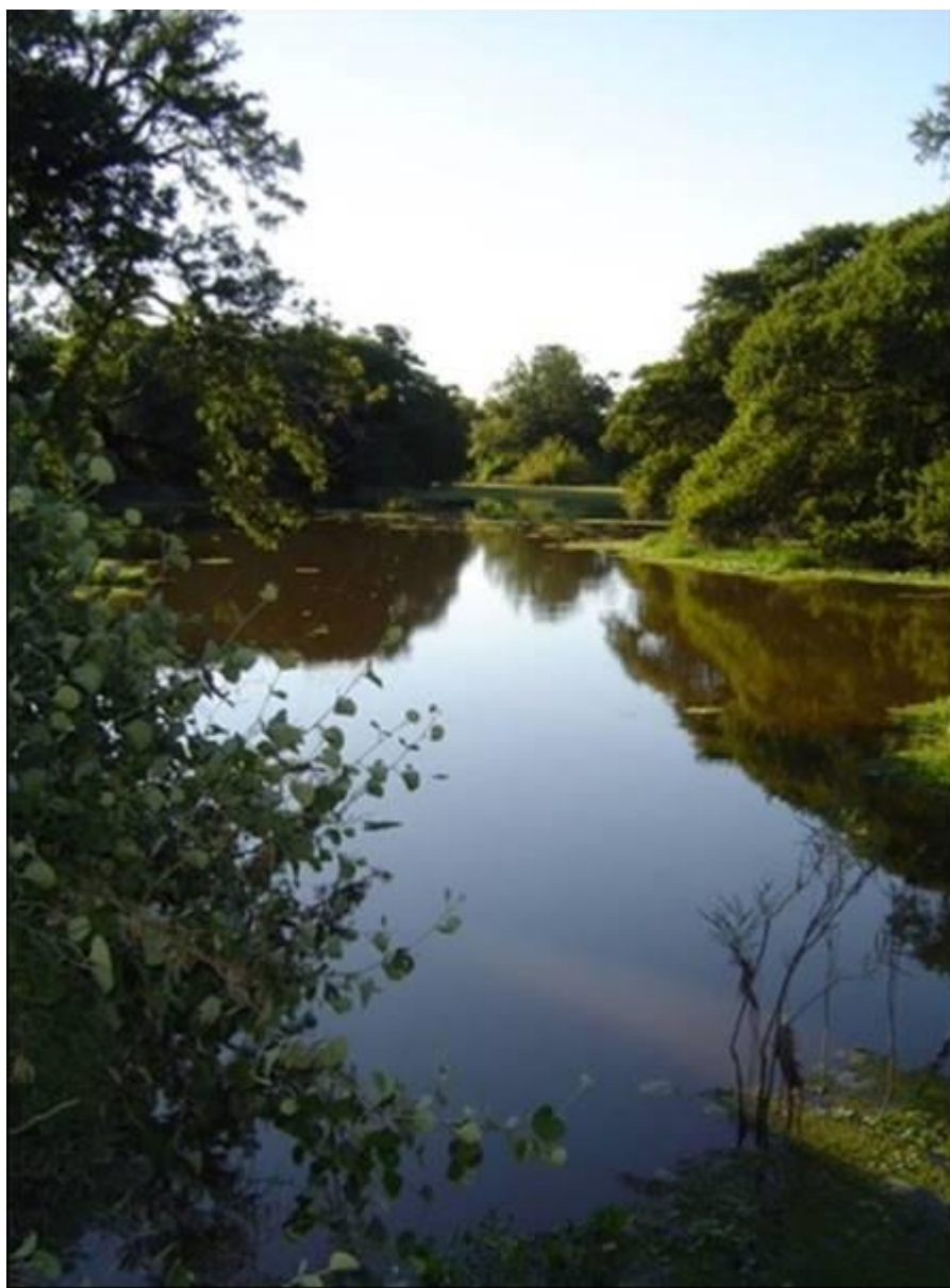
Laguna en cuenca del río Pilcomayo (Salta, Argentina)