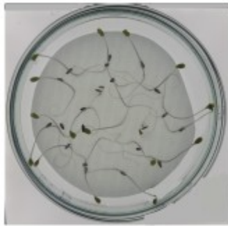
Petri dish (PD)