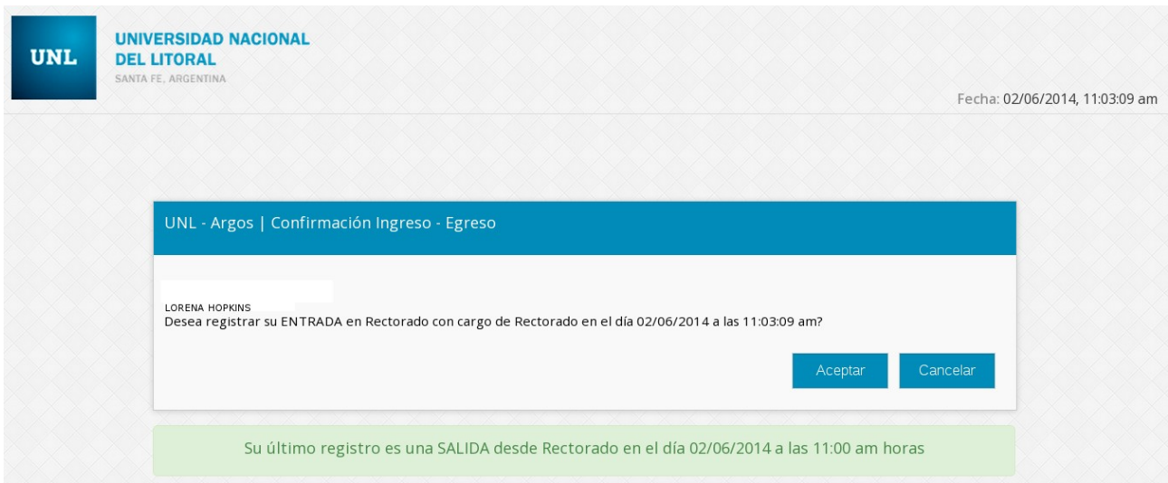
Figura 2.1 – Pantalla de Confirmación de Registro de Entrada/Salida