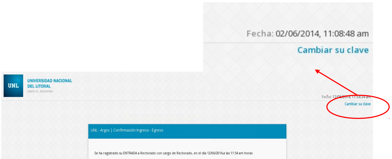
Figura 2.2 – Pantalla de para Cambio de Contraseña (Clave de Usuarios)

Una vez que accedió al sistema, como lo detalla la figura precedente, y selecciona la opción Cambiar Clave, ubicado en el extremo superior derecho de la pantalla el usuario puede, efectivamente, acceder a la opción del sistema para modificar su clave o contraseña de acceso personal, como lo detalla la figura a continuación (Figura 2.3)