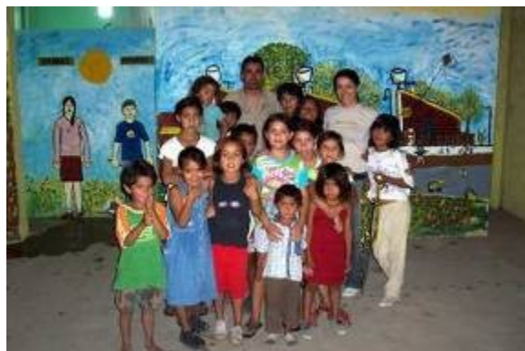
Figura 3. Taller Departamento Rawson