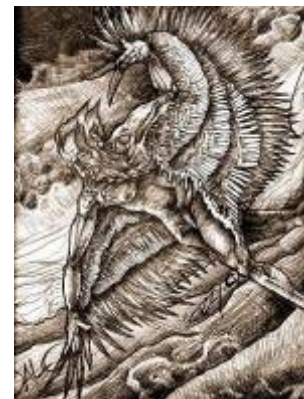
Figura 11. El vuelo de Dédalo