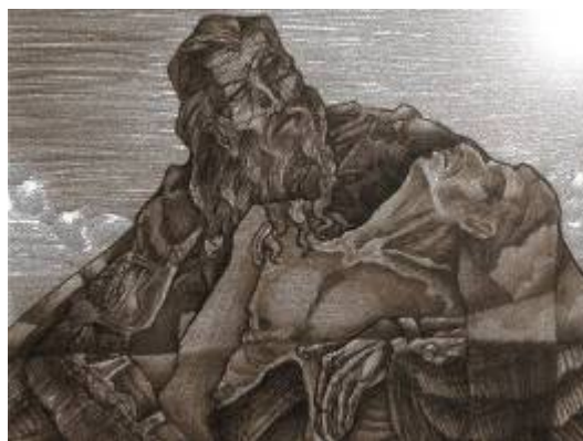
Figura 10. Piedad de Ícaro