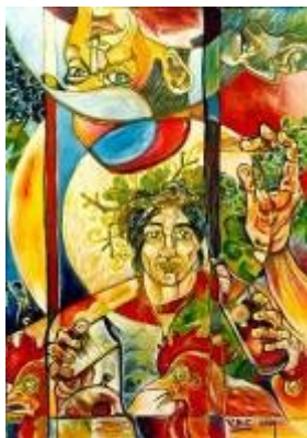
Figura 9. Baco de las Chimbas

Estación Luz (arte digital), Rutas Argentinas (arte digital a partir de acrílico sobre yeso), Fuckland I, II y III (tríptico, óleo sobre lienzo), Baco de las Chimbas (acrílico sobre lienzo, figura 9), Piedad de Ícaro (arte digital a partir de acrílico sobre lienzo, figura 10), El vuelo de Dédalo (tinta sobre papel, figura 11) y Gabriela Mistral (óleo y acrílico sobre lienzo, figura 12).