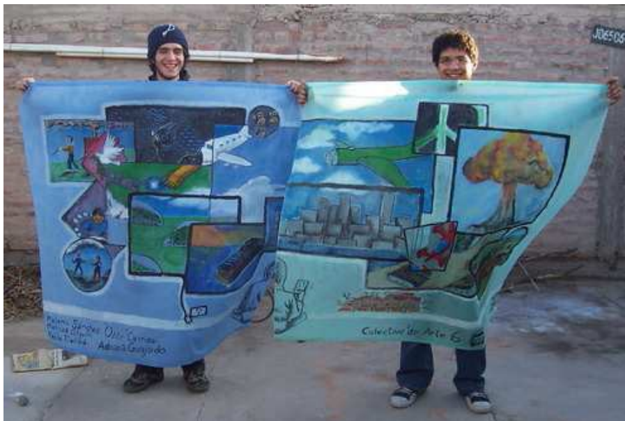
Figura 13. Obra presentada en el II Congreso Internacional Extraordinario de Filosofía .

Pintura mural sobre tela presentada en el II Congreso Internacional Extraordinario de Filosofía , San Juan, Julio de 2007 (figura 13); pintura mural realizada en la Unión Vecinal del barrio Almirante Brown del Departamento de Rivadavia (figura 14) y pintura mural realizada en el Barrio Costa Canal III del Departamento Chimbas (figura 15).