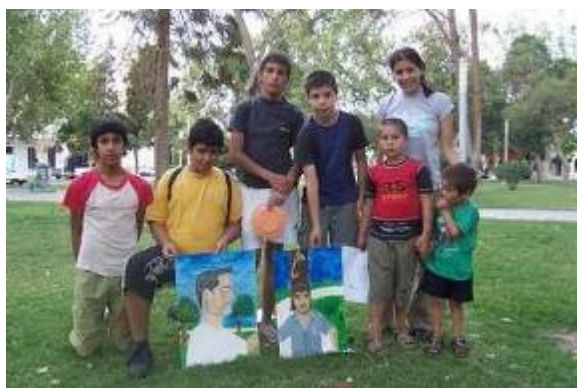
Figura 1. Taller Departamento Santa Lucía

A partir del mes del mes de marzo de 2006, se habilitaron 5 talleres de creación en los departamentos del gran San Juan: Taller Departamento Santa Lucía en el Salón Cultural Municipal con una asistencia promedio de 27 integrantes (figura 1); Taller Departamento Chimbas en el Centro Cultural Municipal con una asistencia promedio de 36 integrantes (figura 2); Taller Departamento Rawson en el Centro Integral Comunitario del Barrio “La Estación” con una asistencia promedio de 42 Integrantes (figura 3); Taller Departamento Rivadavia en la Unión Vecinal del Barrio Gendarmería con una asistencia promedio de 23 Integrantes (figura 4) y Taller Departamento Angaco en el Salón Cultural Municipal, con una asistencia promedio de 34 integrantes (figura 5).