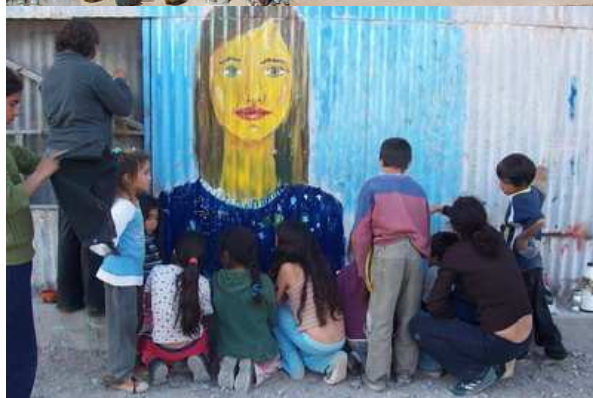
Figura 14. Mural realizado en la Unión Vecinal del Bº Almirante Brown de Rivadavia.