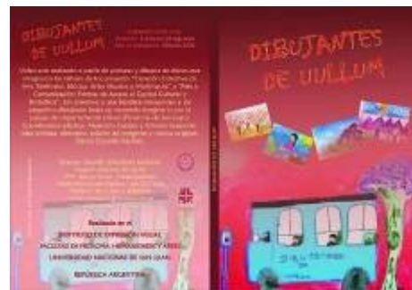
Figura 6. Portada y contraportada del video Dibujantes de Ullum

Formato .AVI – DVD NTSC / Duración: 3 minutos 30 segundos. Realizado a partir de pinturas y dibujos de chicos del departamento Ullum de la provincia de San Juan que integraron los talleres del proyecto. Un colectivo y una bicicleta transportan a los pequeños dibujantes hacia un recorrido imaginario por el paisaje de dicho departamento (figura 6).