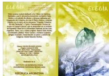
Figura 7. Portada y contraportada del video Elegía

Formato .AVI – DVD NTSC / Duración: 3 minutos 20 segundos. Video poema musical dedicado a la memoria de los Chicos de Malvinas. Realizado a partir del poema homónimo de Beatriz Della Motta y la edición de pinturas y dibujos originales realizados por integrantes de los talleres (Pablo Molina y Mathías Olguín). Música y arreglos originales en piano (figura 7).