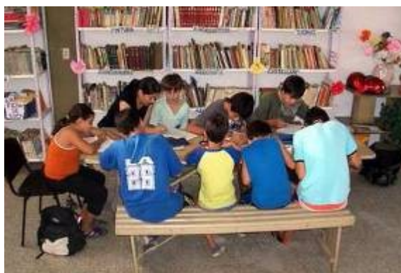
Figura 2. Taller Departamento Chimbas