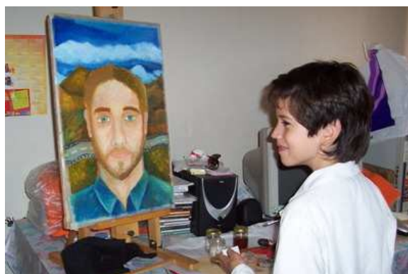
Figura 4. Taller Departamento Rivadavia