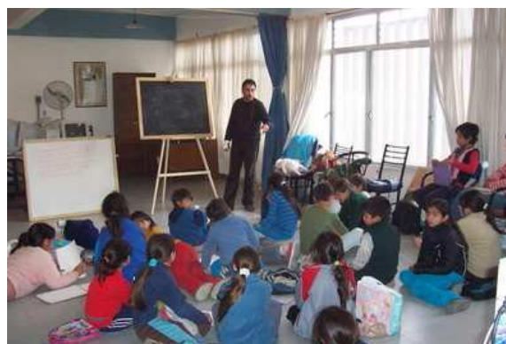
Figura 5. Taller Departamento Angaco

Cada taller fue conformado por grupos con expectativas, necesidades y demandas particulares. Estas características requirieron un abordaje específico para la conducción del proceso pedagógico y el logro de producciones artísticas grupales. Esta heterogeneidad, reflejada desde las variadas edades de los integrantes, los distintos grados de vulnerabilidad social e incluso la participación de niños con necesidades especiales, condujo necesariamente a la adopción de distintas estrategias en el planteo y presentación de temas, contenidos y técnicas artísticas desarrolladas, las que se adecuaron a la realidad socio-cultural de cada participante y grupo conformado, atendiendo procesos de seguimiento individual y evaluación continua.