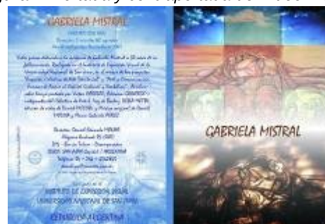
Figura 8. Portada del video Gabriela Mistral

Formato .AVI – DVD NTSC / Duración: 5 minutos 40 segundos. Video Poema dedicado a la memoria de Gabriela Mistral a 50 años de su fallecimiento, a partir de acrílico sobre lienzo realizado por coordinadores y participantes de los talleres; y del poema Palabras Serenas de Gabriela Mistral (figura 8).