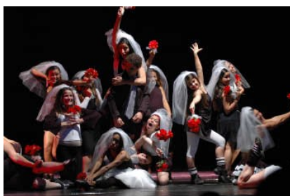
Atelier Coreográfico: 2007 "Vexame"

Além da parte prática de preparação corporal, noções de cenografia, figurino e iluminação, trabalho de pesquisa de movimento para criação de personagens, procura fornecer material reflexivo para a compreensão do espetáculo e da cena teatral como um acontecimento factual , a despeito da formalização estética resultante no palco; esclarece a importância de conceber o acontecimento teatral a partir do sentido principal da interpretação pessoal que o coreógrafo e/ou os atores-bailarinos têm da obra; permite perceber a concepção idealizada para o evento cênico como o eixo que determinará o caráter do espetáculo; e, por fim, mostra que o acontecimento cênico , para ocorrer, necessita ser concebido de modo a estimular uma presença (cri)ativa por parte do ator-bailarino.