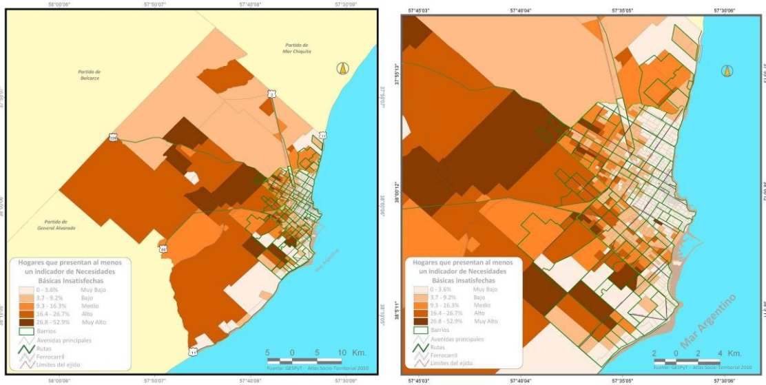
Figuras N° 2 y 3: Pobreza estructural y coyuntural del Partido de General Pueyrredón y Mar del Plata.

Estos conflictos se inscriben dentro de un espacio geográfico; entiendo a dicho espacio, siguiendo a Santos, M (2009) como “un reflejo de la sociedad y un condicionante de la evolución de las estructuras sociales, que denota el modo de producción actual y los modos de producción pasados” (Santos; 2009: 148). Se considera que sus consecuencias múltiples y complejas gestan una situación de alta vulnerabilidad para la población.