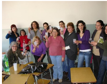
Imágenes N° 5 y 6 : Desarrollo del taller y brindis final en Batán