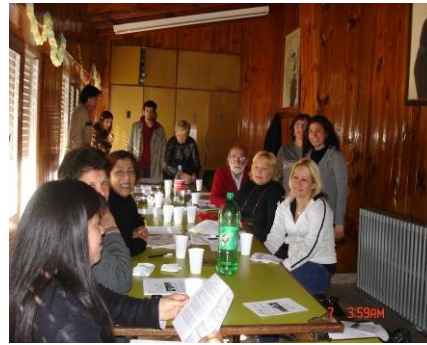
Imágenes N ° 3 y 4: Interacción entre voluntario-emprendedores y entre participantes.