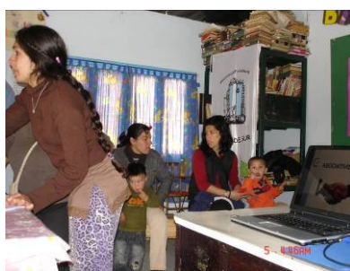
Imagen N° 1 Momento previo al Taller en Barrio San Jacinto

La selección de los barrios destinatarios estuvo dada a partir del análisis de las problemáticas sociales citadas, con la colaboración del “Banco Popular de la Buena Fe” durante el 2009, y de la “Fundación Sol de Mayo” durante el 2010”, quienes nos condujeron a aquellos espacios, en que la población presenta mayores problemas de precariedad laboral. Finalmente el curso-taller-curso se llevó a cabo en 4 ocasiones programadas por año, en: Sociedad de Fomento Barrio Coronel Dorrego, Escuela Técnica Municipal de Batán Nº 7, Sociedad de Fomento de La Gloria de la Peregrina, Colegio Secundario “La Sagrada Familia” (2009); Sociedades de Fomento del Barrio Belgrano, Las Dalias, San Jacinto (Playas del Sur), y, en la Institución APAND (Asociación Pro-Ayuda a la Niñez Desamparada). (Imágenes 1 y 2)