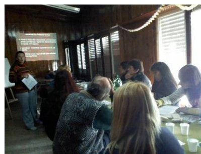
Imagen N° 2: Desarrollo de temáticas en APAND.