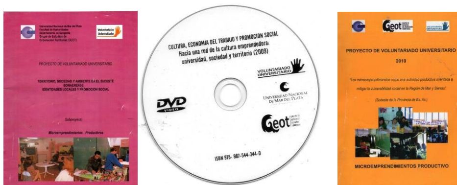
Figura 12, 13 y 14: Material de difusión elaborado.

Como producto final, los estudiantes voluntarios elaboraron material bibliográfico, asignado gratuitamente a la población partícipe del curso. Entre ellos se destacan dos publicaciones bibliográficas en formato libro y un DVD documental. (Figura 12, 13, 14)