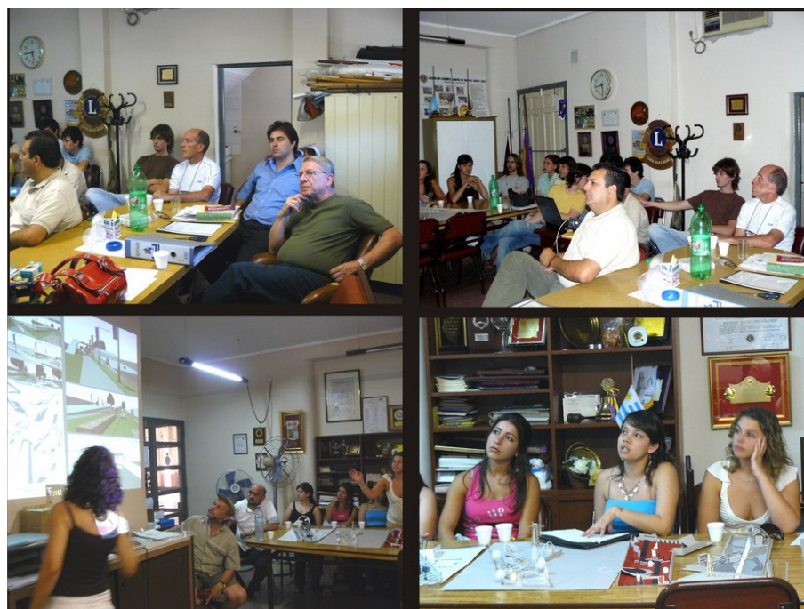
Talleres de Participación y Opinión -ACIPA

Como consecuencia de la vinculación con la institución Intermedia ACIPA, se estableció, un contacto alternativo e incipiente con profesionales de la esfera municipal vinculados a la problemática del Espacio Público, invitados por la institución anfitriona, lo que permitió poner en su conocimiento el tipo de actividad extensionista de la UNL que lleva adelante este proyecto PEC.