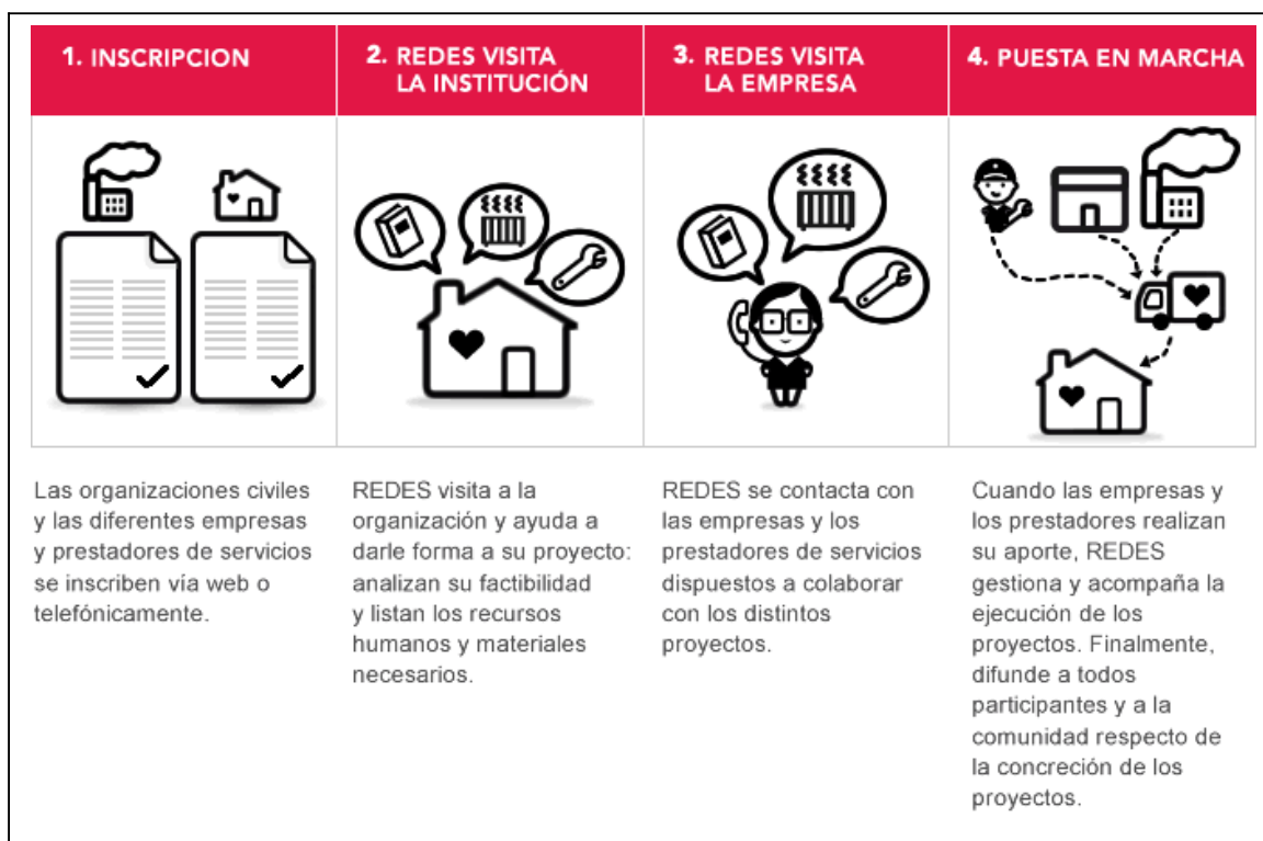
Figura 2. Mecanismo de funcionamiento de REDES

organizaciones de la sociedad civil, la responsabilidad social empresaria, técnicas de entrevista, condiciones para que las empresas puedan desgravar parte del impuesto a las ganancias a partir de donaciones realizadas y, especialmente, el mecanismo de funcionamiento del proyecto.