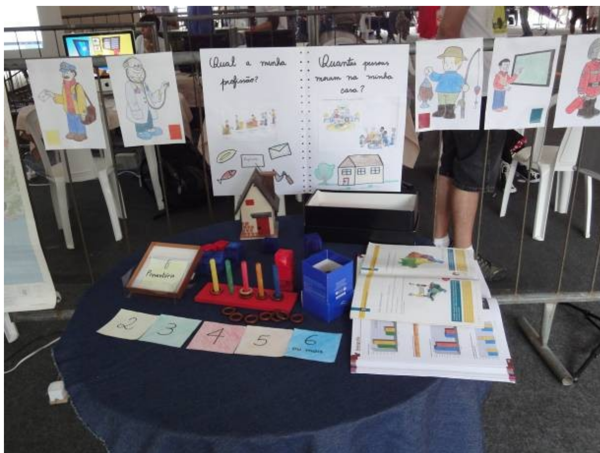
Figura 1: Materiais didáticos do projeto “Aprendendo a recensear” expostos para aplicação com os estudantes da educação básica visitantes da VII Semana Nacional de Ciência e Tecnologia.

O principal referencial teórico encontra-se em Raffestin (1993), que define população como “um conjunto finito e, portanto, num dado momento ‘recenseável’” e concluindo que “o recenseamento é um saber, portanto um poder”. Para levar esta realidade macro à realidade do educando é necessário o uso de materiais didáticos alternativos, entendidos por Gomes et al (2001) como ótimas ferramentas para o ensino de alguns conteúdos de difícil aprendizado.