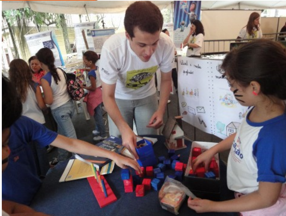
Figura 2: Aplicação do material didático “Aprendendo a recensear”.