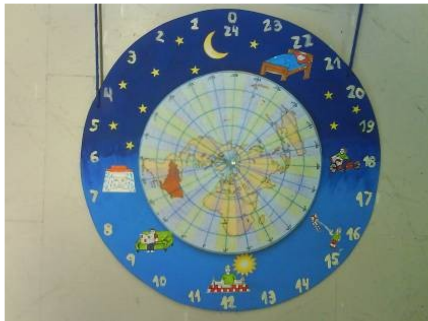
Figura 4: Material didático intitulado "Viajando pelos fusos horários", em detalhe o relógio de fusos horários.