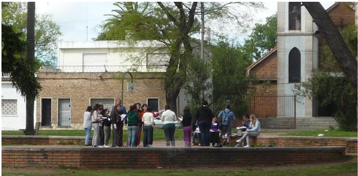
Figura 4. Estudiantes de Medicina, Trabajo Social y Docentes del PIM, momentos antes del relevamiento realizado en el Barrio Ituzaingó.

Al formulario realizado por los estudiantes de Trabajo Social se le adjuntó otro formulado por los estudiantes de Medicina con preguntas referentes a la salud vinculada a la temática ambiental.