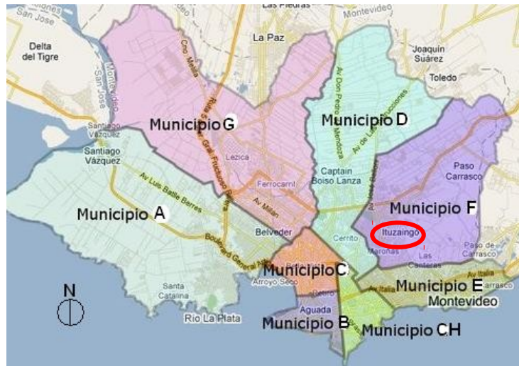
Figura 2: Plano de Montevideo, ubicación del Barrio Ituzaingó: —

La idea que define al territorio se construye apegada a lo espacial: límites del barrio, la ciudad, la comunidad, la localidad, etc. Los individuos se apropian de un territorio y lo delimitan de diferentes formas, así va a quedar demarcado un espacio propio de determinada población.