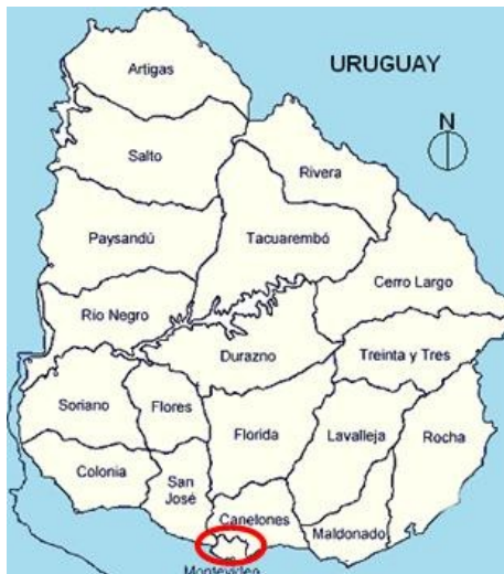
Figura 1: Plano de Uruguay, ubicación de la ciudad de Montevideo: —