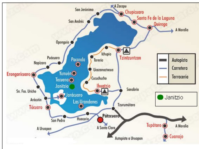
Mapa 1- Marca la localización de la isla de Janitzio en lo que conforma la zona lacustre del lago de Pátzcuaro