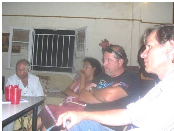
Reunión con las autoridades del Municipio para tratar el tema de los cuatriciclos en la zona de playas y Médanos