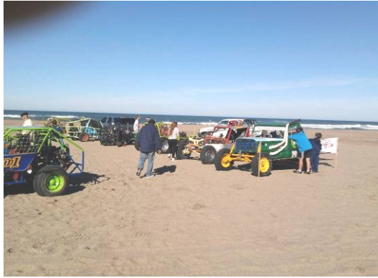
Concentración de vehículos durante los fines de semana