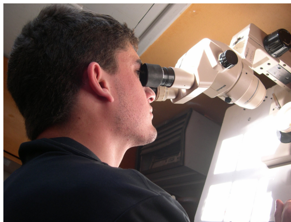
Observación de muestras del agua filtrada del arroyo por docentes y estudiantes bajo la supervisión de los estudiantes de la Licenciatura en Ciencias Biológicas