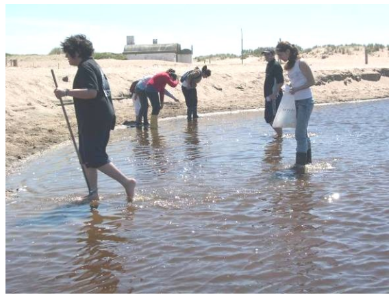
Medición de caudal y filtrado de microorganismos