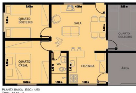
Figura 4 – Planta de la casa de 2 cuartos (izquierda) y de 3 cuartos (derecha.)