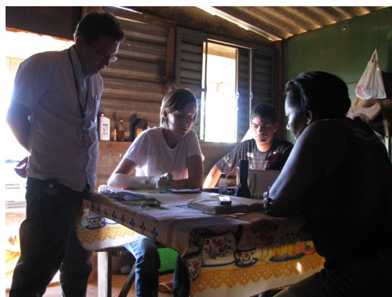
Figuras 2 e 3 – Charlas con los moradores de la Colonización Itaúna.

La distribución de los ambientes fue pensada para aprovechar el espacio interno de la casa y para reducir los costos de la construcción. El proyecto elimina el corredor que lleva a los cuartos, propone una cocina integrada a la sala, y concentra los conductos del baño y de la cocina en una única pared. Trabaja-se también con paredes lineares; esa estrategia disminuí la complejidad de las funciones y ofrece la estructura necesaria para el apoyo del techo. Pero estas características no limitan completamente el proyecto. Los dibujos son llevado para la discusión con los moradores que pueden pedir alteraciones que se adapten a sus necesidades.