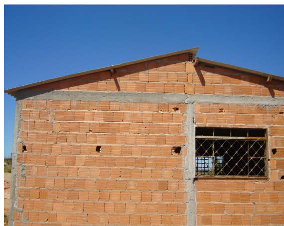
Figuras 6 e 7 – Antigua Casa (izquierda) e a Morada Actual (derecha) de una familia de la Colonización Itaúna construida con el proyecto PHISAR.