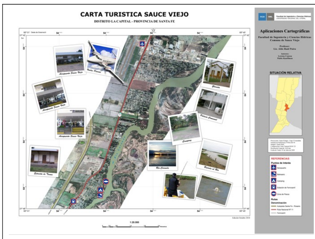
Figura 4: Carta turística de Sauce Viejo.