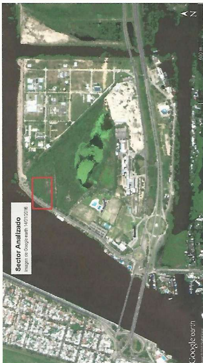
Figura N°2 – Imagen de Google Earth correspondiente a última crecida extraordinaria del Río Paraná.

Con esto se le confiere al sector a intervenir la condición de NO INUNDABLE.