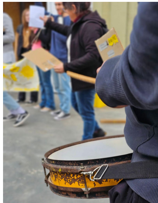
Fotografía de personas durante la marcha de los colores en la Activación Bienal en el Centro Comunitario Playa Norte de Santa Fe, el 4 junio de 2024. Se ven carteles y un redoblante.