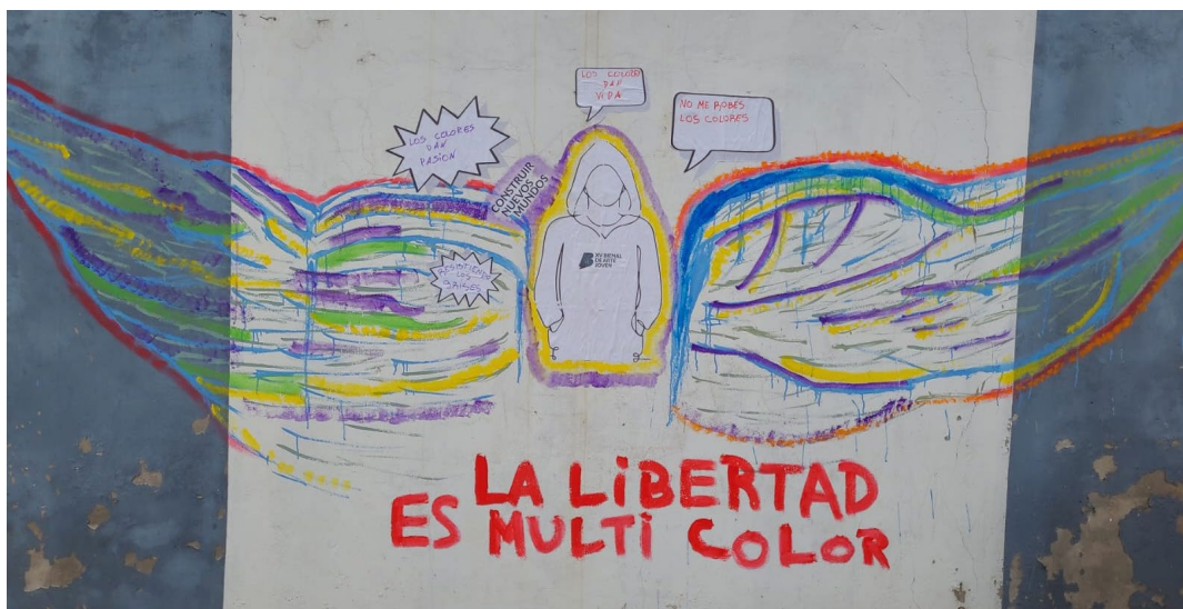
Fotografía de un mural pintado durante la Activación Bienal en el Centro Especializado de Responsabilidad Penal Juvenil y el Centro de Capacitación Laboral para Adultos CECLA N° 114 de Santa Fe, el 12 de junio del 2024. La imagen contiene alas de diversos colores y la frase "La libertad es multicolor"