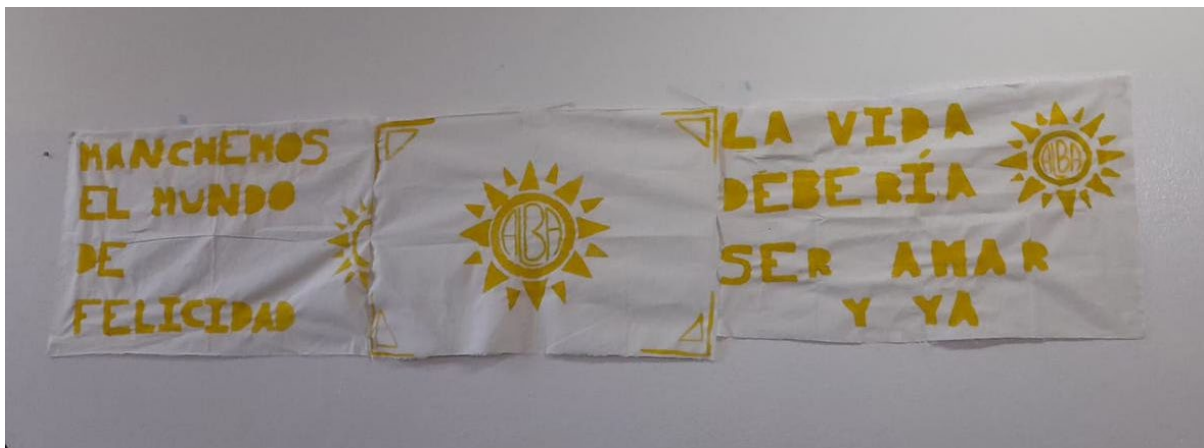
Tela pintada durante la Activación Bienal en el 5to año de la modalidad Visuales de la Escuela Nacional ESSO N° 428 "Luisa María Raimondi de Barreiro", de Rafaela (Santa Fe), el 26 junio de 2024. Contiene la frase "Manchemos el mundo de felicidad" y "La vida debería ser amar y ya".

vez más, sus puertas a la construcción colectiva del conocimiento, la ciencia, la tecnología y el desarrollo de la cultura, las artes en todos sus lenguajes y manifestaciones, las identidades diversas, el ambiente sostenible y los derechos humanos. La diversidad de disciplinas y la pluralidad de perspectivas teóricas e ideológicas propias de las universidades públicas impulsan la riqueza de debates, consensos y la generación de nuevas narrativas de lo común que reconozcan y hagan lugar a la creación de nuevos modos de afrontar las dificultades y de nuevos horizontes, presentes y futuros, en que se haga efectivo el acceso a los derechos y se gesten paridades. La Bienal es el lugar que privilegiamos para las nuevas formas de encuentro y convivencia en las que todas las voces, la creatividad y la expresión en libertad son protagonistas.